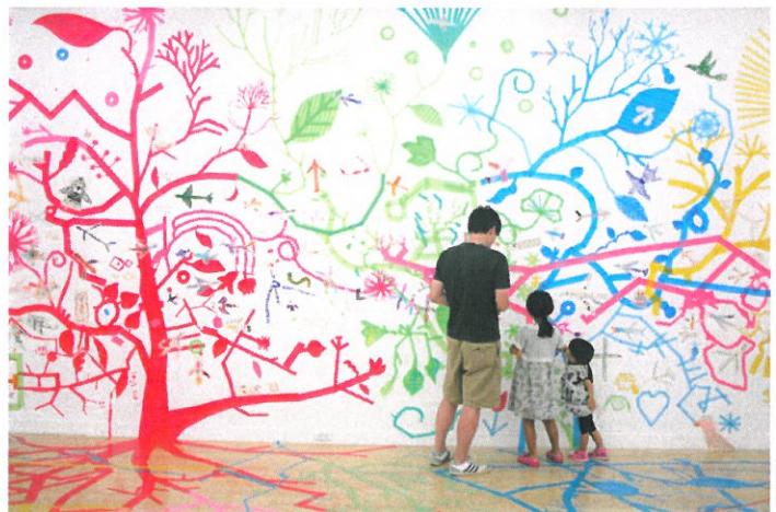
「テーブ森をつくらう」(ワークショップイメージ)

後援 横浜市文化観光局、神奈川新聞社、t v k、 RF ラジオ日本、FM ヨコハマ、 横浜市ケーブルテレビ協議会