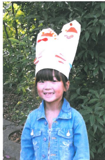
「アート・ハット」(ワークショップイメージ)