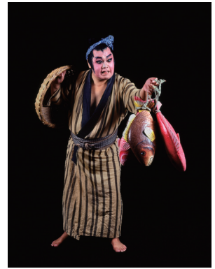
《沖縄芝居》 1989-1992年（2012年プリント） インクジェット・プリント