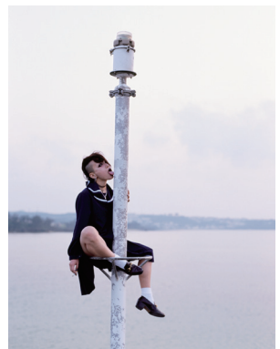
《森花—夢の世界》 2012年 インクジェット・プリント