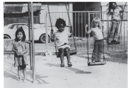
《熱き日々 in オキナワ》 1975-1977年 ゼラチン・シルバー・プリント