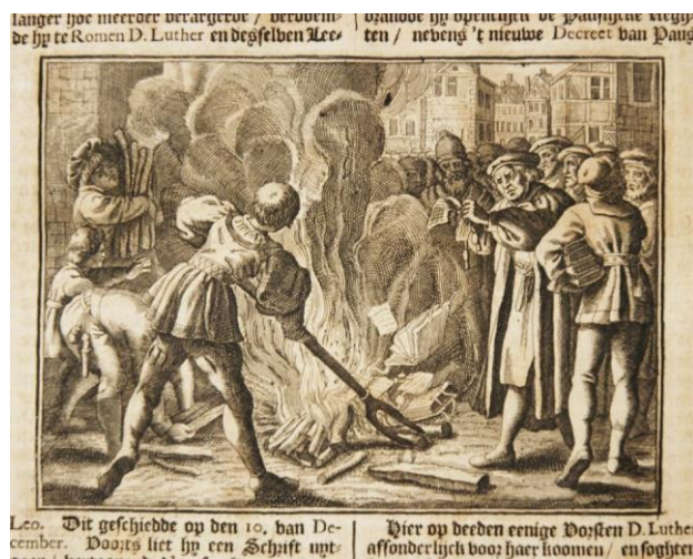
上: マテウス・メリアン (1593-1650) 《教会法を焼き捨てるルター博士》 銅版画、10.1 × 13.8cm 『史的年代記』より